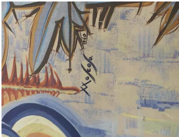
Figura 3. Detalle pictórico del mural ubicado en zaguán de acceso a facultad de Ciencias Políticas y Sociología, con especificación de firma de autoría (Moscoso) y fecha de finalización (1960).

Se están desarrollando, a petición de los responsables de algunos Centros Universitarios los ante-proyectos restauradores de algunos Bienes Culturales singulares. Es el caso del Mural Pictórico del zaguán de acceso a la Facultad de Ciencias Políticas y Sociología-UGR para determinar sus principales daños, indicar el proceso restaurador y conservador necesario, así como una valoración de los costes (figura 3).