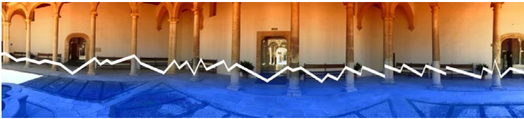
Figura 2. Metáfora gráfica, panorámica, que puede ilustrar el estado de conservación del Patio de la Capilla del Hospital Real

En relación a la proyección profesional y su vinculación con la Universidad de Granada se han llevado a cabo varios importantes proyectos impulsados por nosotros: el proyecto de intervención restauradora del Patio de la Capilla del Hospital Real (sede Rectorado). Parte de esta intervención restauradora fue realizada durante los cursos académicos 1996, 1997 y 1998 en el contexto de las prácticas docentes de la asignatura de Restauración de Materiales Pétreos, la cual no pudo ser finalizada en su perímetro inferior (columnata). Actualmente se está finalizando el diseño restaurador de esta estancia arquitectónica para completar el cuerpo inferior no intervenido y su continuación hasta la balaustrada y pasamanos del corredor ubicado en el cuerpo superior (figura 2).