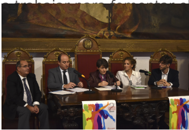
Imagen del acto de presentación de la “II Carrera Urbana