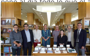
Los componentes del jurado.

Premio a la mejor coedición interuniversitaria. Fallo ex aequo. “Diccionario político y social del mundo iberoamericano” (Universidad del País Vasco / CEPC), “por ser la edición de un ambicioso proyecto de investigación internacional sostenido por dos instituciones de prestigio”; y “Shakespeare en España. Bibliografía anotada” (Universidad de Murcia / Universidad de Granada), “una obra oportuna sobre Shakespeare en su aniversario, realizada por el mayor especialista en el tema que pone al día todo lo que el autor escribió sobre España”