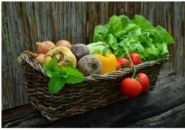
Fotografía de verduras frescas.