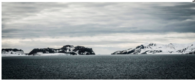
FOTO: Interior del cráter del volcán Isla Decepción.

La Campaña Antártica está coordinada por el Comité Polar Español y financiada por el Ministerio de Economía y Competitividad del Gobierno de España.