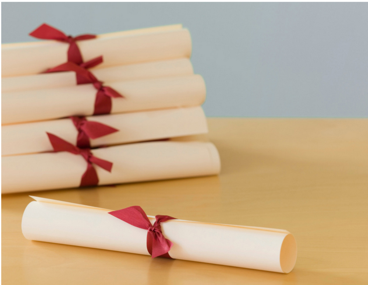
Procedimientos de expedición de títulos y legalización/apostillado documentos