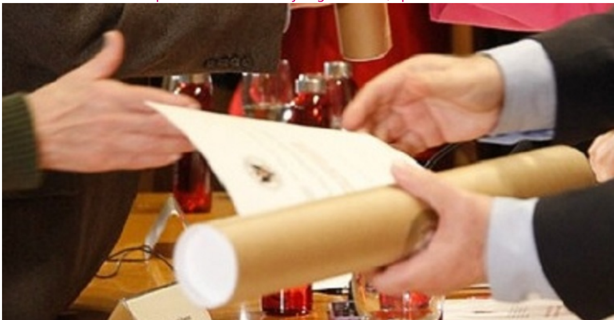
Certificaciones supletorias provisionales (pretítulos)