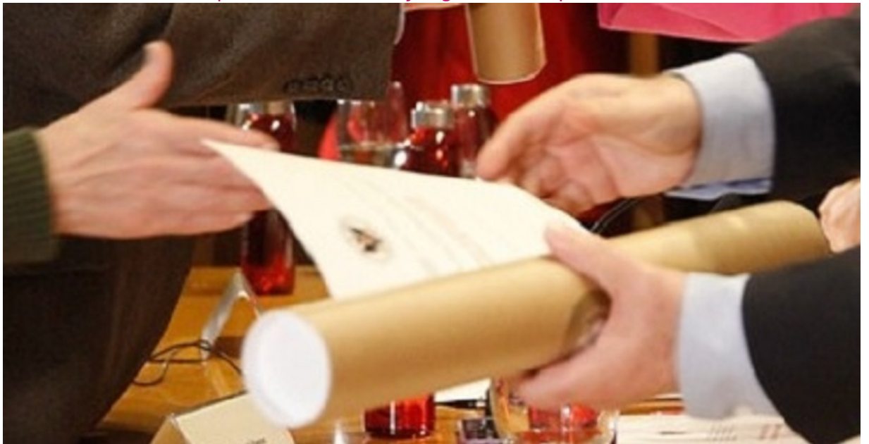
Certificaciones supletorias provisionales (pretítulos)