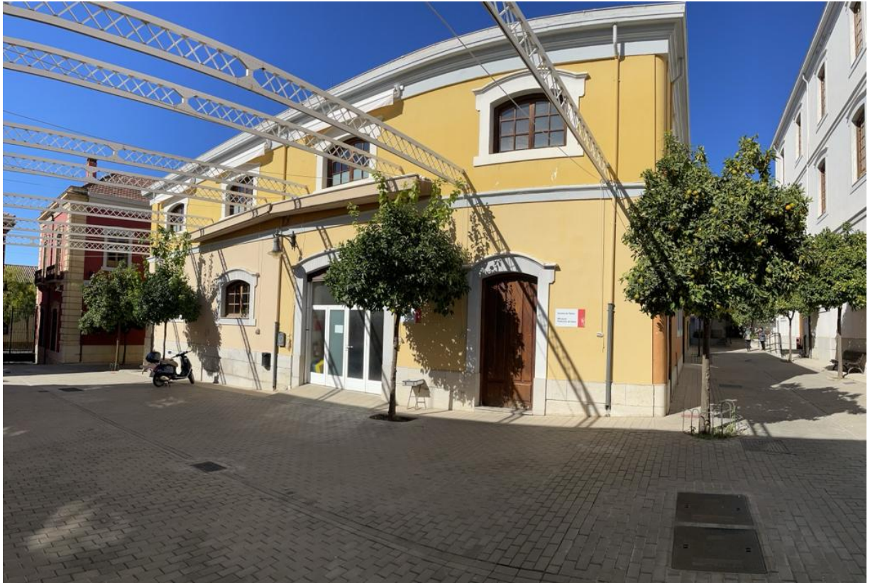
Localización y contacto