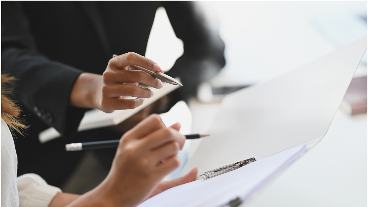
Recomendaciones e infografías