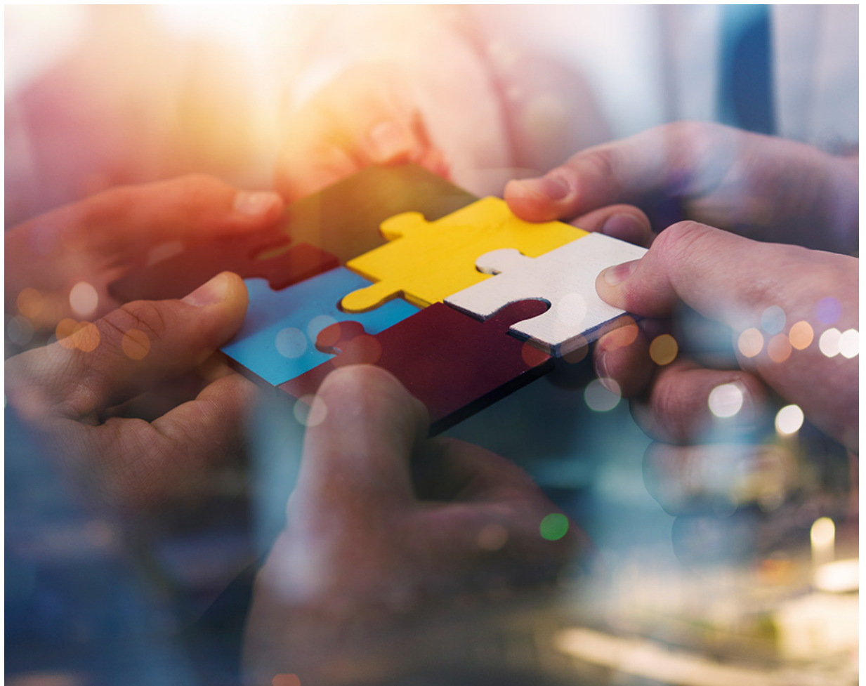
El equipo de protección de datos