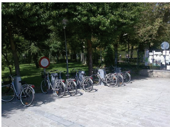
Fotografía 2: Sistema de préstamo de bicicletas - UGR. Bancada E.U. Arquitectura Técnica.