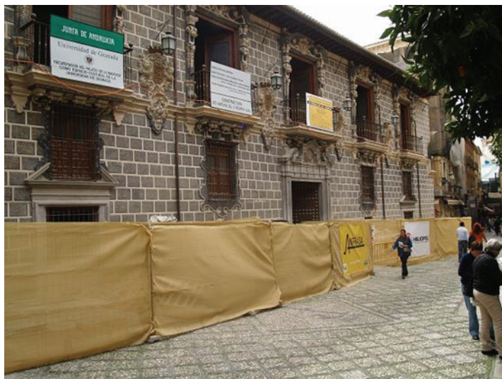
Fotografía 4: 3ª y última fase de recuperación de la Madraza para espacios de extensión universitaria de la UGR.