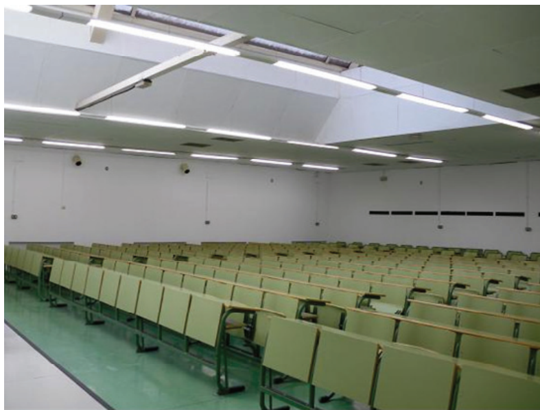
Fotografía 5: Rehabilitación de espacios docentes en el Colegio Máximo.