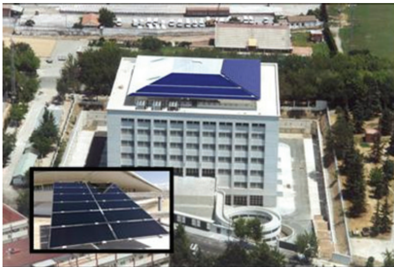
Fotografía 1: Instalación fotovoltaica en la cubierta del Edif. Politécnico.