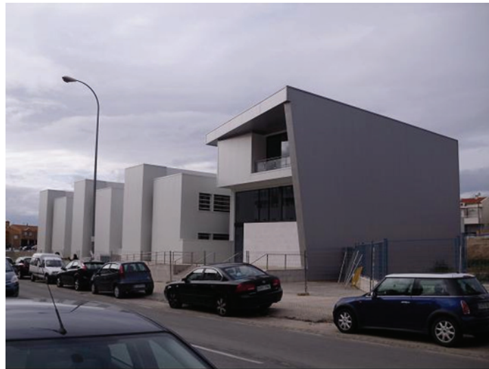
Fotografía 6: Finalización de las obras del CITIC.