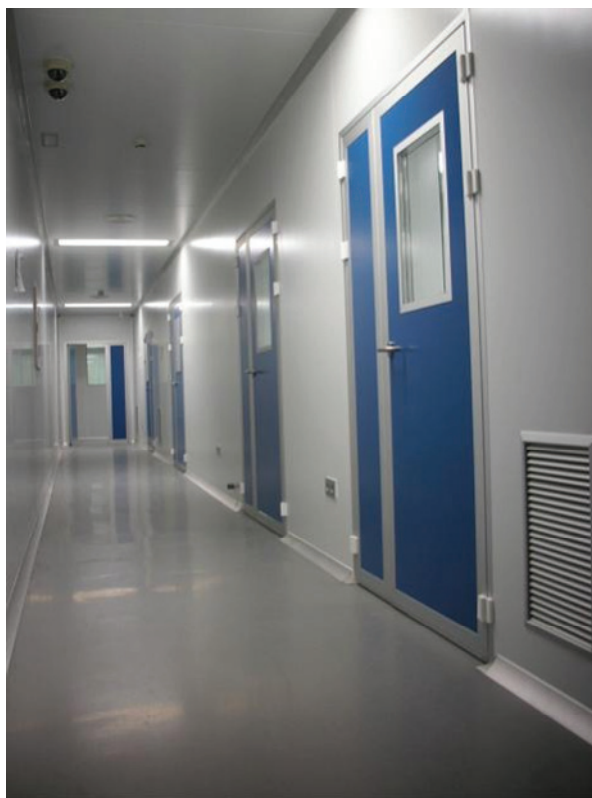
Fotografía 8: Finalización del Centro de Producción Animal del CIBM.