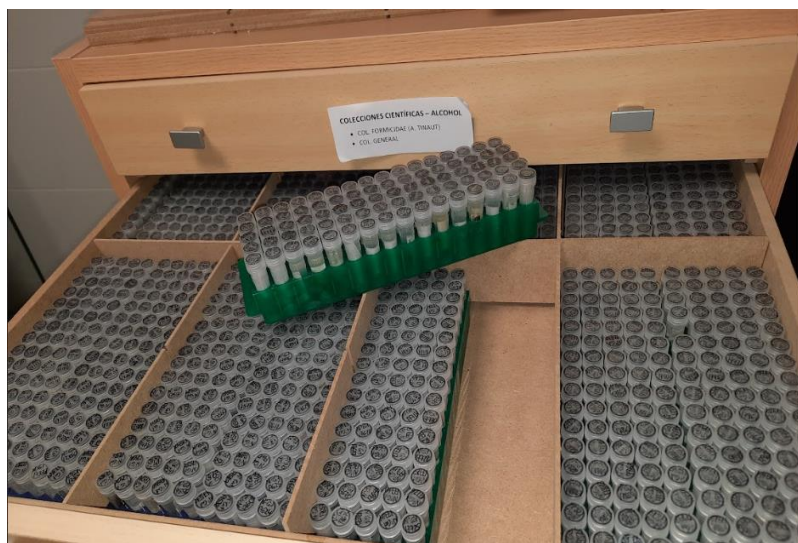
Armario de muestras en alcohol